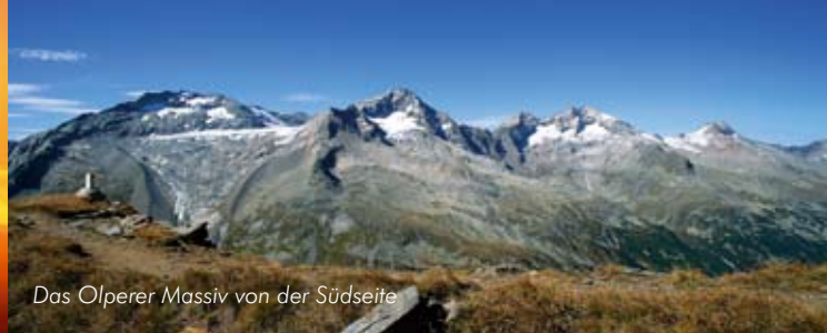
Das Olperer Massiv von der Südseite