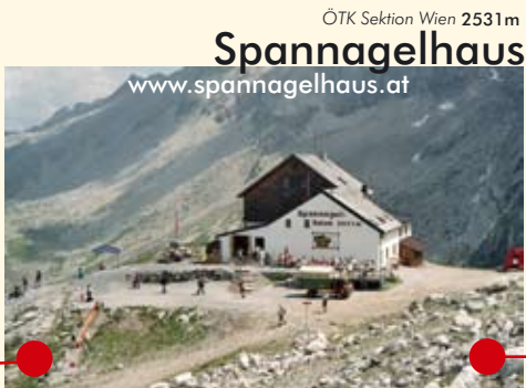
ÖTK Sektion Wien 2531m Spannagelhaus www.spannagelhaus.at

Olpererhütte Schöner Rastplatz um Energie aufzutanken für den weiteren Weg.