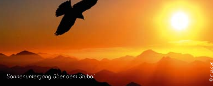
Sonnenuntergang über dem Stubai