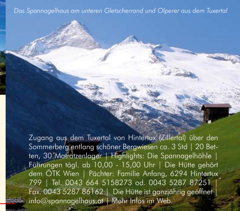
Das Spannagelhaus am unteren Gletscherrand und Olperer aus dem Tuxertal

Zugang aus dem Valsertal St.Jodok (Wipptal), über flach angelegten Weg ca. 2-3 Std. | Die Hütte gehört dem DAV Sektion Landshut. | 25 Betten, 75 Matratzenlager | Highlights: Faszinierende Sonnenuntergänge über den Stubai Alpen | Pächter: Katharina u. Arthur Lanthaler, Postfach 35, A-6154 Vals/St.Jodok | Tel. Hütte 0043 676 9610303 | im Winter, Maurerweg 5, I-39049 Sterzing | Tel. 0039 0472 766710 | Geöffnet Mitte Juni - Anfang Oktober | Rucksacktransport möglich | Hütten-Umweltgütesiegel | info@geraerhuette.at | Mehr Infos im Web.