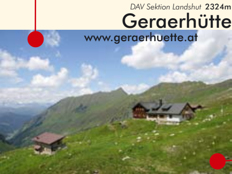
DAV Sektion Landshut 2324m Geraerhütte www.geraerhuette.at

Zugang aus dem Valsertal St.Jodok (Wipptal), über flach angelegten Weg ca. 2-3 Std. | Die Hütte gehört dem DAV Sektion Landshut. | 25 Betten, 75 Matratzenlager | Highlights: Faszinierende Sonnenuntergänge über den Stubai Alpen | Pächter: Katharina u. Arthur Lanthaler, Postfach 35, A-6154 Vals/St.Jodok | Tel. Hütte 0043 676 9610303 | im Winter, Maurerweg 5, I-39049 Sterzing | Tel. 0039 0472 766710 | Geöffnet Mitte Juni - Anfang Oktober | Rucksacktransport möglich | Hütten-Umweltgütesiegel | info@geraerhuette.at | Mehr Infos im Web.