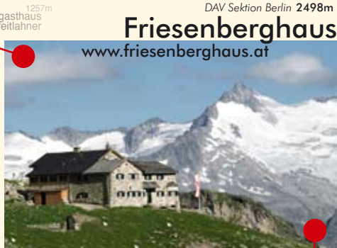
DAV Sektion Berlin 2498m Friesenberghaus www.friesenberghaus.at