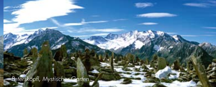
Petersköpfel, Mystischer Garten